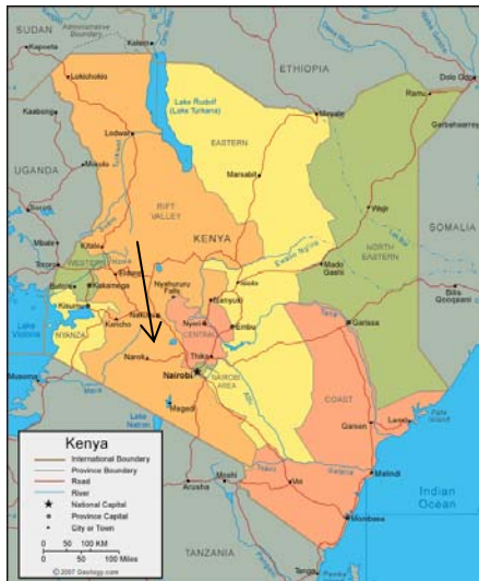
Figure 1 : Carte des provinces du Kenya et emplacement d'Eldoret

La gouvernance locale au Kenya se fait par le biais des autorités locales . De nombreux centres urbains accueillent des conseils urbains, citoyens ou municipaux. Dans les milieux locaux, les autorités locales sont connues comme conseils de comtés . Les conseillers locaux sont élus lors d'élections civiques, qui se déroulent en parallèle aux élections générales. Eldoret, qui fait l'objet de ce cas, est gouverné par un conseil municipal .