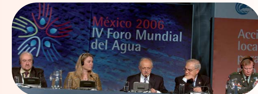
Foro Mundial del Agua de México

Los gobiernos del mundo reconocen que las autoridades locales desempeñan un papel crucial en la prestación de acceso sostenible al agua y a los servicios de saneamiento, así como en el apoyo a la gestión integrada de los recursos hídricos. La Declaración de los Gobiernos Locales de CGLU se incluye en la declaración final del Foro Mundial del Agua de marzo de 2006.