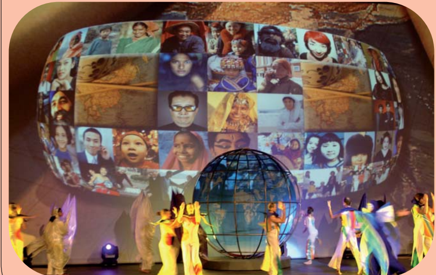
Congreso Fundador de París - Mayo 2004