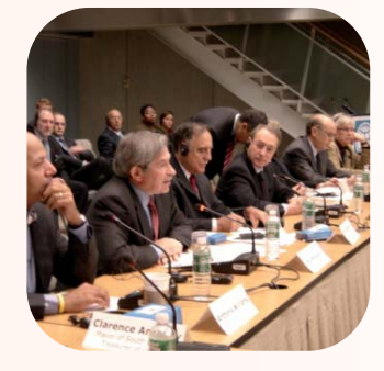
Reunión con el Banco Mundial - Bureau Ejecutivo de Washington - Febrero 2006

En las reuniones del Bureau Ejecutivo de CGLU en Washington, el Presidente del Banco Mundial Paul Wolfowitz manifiesta el interés de su institución por reforzar las relaciones con CGLU y se compromete a desarrollar nuevos instrumentos para apoyar el desarrollo urbano.