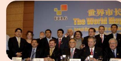
Consejo Mundial de Beijing - Junio 2005

Se crean las primeras Comisiones y Grupos de Trabajo de CGLU, abiertos a las ciudades, los gobiernos locales y sus asociaciones. Actualmente, las Comisiones y los Grupos de Trabajo cubren más de 18 temas distintos.