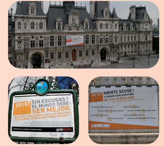
Campaña de las Ciudades del Milenio de CGLU - París - Buenos Aires - Roma

En la Cumbre del Milenio +5 de Nueva York, el Secretario General de las Naciones Unidas Kofi Annan y el Presidente de la Asamblea General de las Naciones Unidas Jan Eliasson se reúnen con una delegación de alcaldes de CGLU. En la declaración final se reconoce a las autoridades locales como actores para la consecución de los Objetivos de Desarrollo del Milenio. Las ciudades, regiones y asociaciones se movilizan para contribuir a abordar los retos mundiales con un impacto local evidente: Más de mil ciudades y asociaciones de gobiernos locales se suman a la destacada Campaña de las Ciudades del Milenio de CGLU . Se cuelgan banderolas blancas en ayuntamientos y edificios municipales de todo el mundo. Centenares de ciudades se suman a "Detén el SIDA. Haz la promesa" y coordinan sus actos de conmemoración del Día Mundial de la Lucha contra el SIDA.