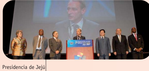
Presidencia de Jeju

CGLU constituye el primer proyecto de estudio integral del estado de la descentralización mediante la creación del Observatorio Mundial sobre la Descentralización y la Democracia Local (GOLD) , por sus siglas en inglés. El informe hace hincapié en el estado de los gobiernos locales en todas las regiones del mundo y demuestra el progreso de la autonomía local en todo el mundo durante las dos últimas décadas.