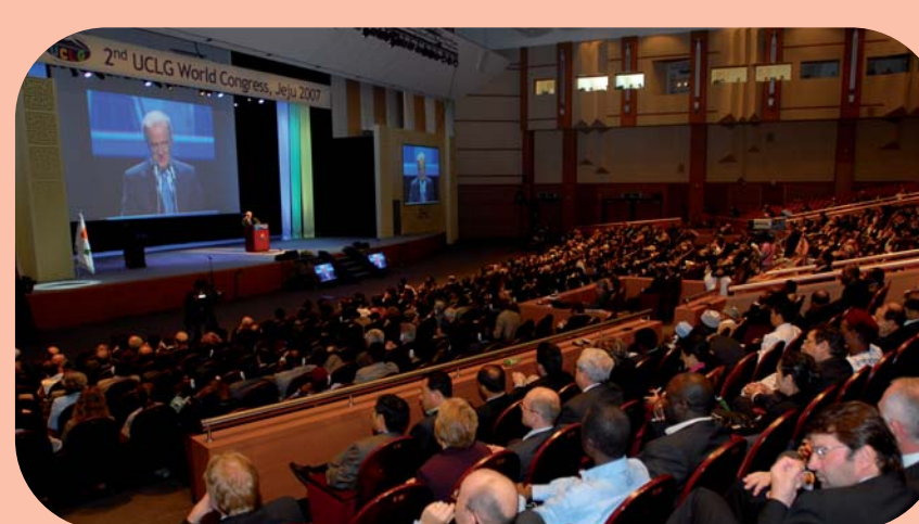
Congreso de Jeju - Octubre 2007

En el II Congreso Mundial de CGLU , celebrado en Jeju (Corea del Sur), unos 2.000 alcaldes y gobernantes locales se reúnen para debatir las consecuencias de la expansión urbana, la cooperación con las regiones y los retos para la ciudad del futuro. El Documento de orientación sobre finanzas locales adopta 25 recomendaciones concretas, como redirigir la ayuda al desarrollo al